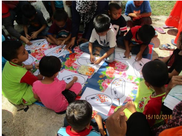
Antara Aktiviti Permainan yang dijalankan oleh Booth Pusat Internet 1Malaysia Kluster Gua Musang