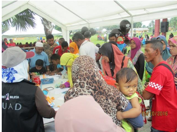
Antara pengunjung yang hadir di Booth Pusat Internet 1Malaysia yang terdiri daripada pelbagai lapisan umur