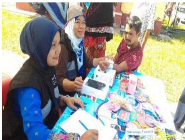
Antara pengunjung yang memeriksa tahap kesihatan dengan menggunakan Peralatan I-health yang telah dibekalkan untuk Program Dashboard MyHealth