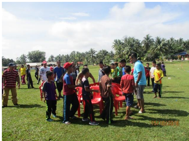
Antara Aktiviti Sukan dan Riadah yang dipertandingkan pada hari tersebut yang melibatkan pelbagai kategori umur dan jantina