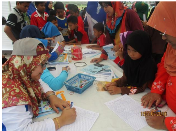
Sesi Pendaftaran pengunjung dan pembahagian Nombor cabutan bertuah