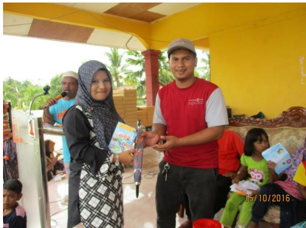
Antara pengunjung yang memenangi hadiah untuk kategori Cabutan nombor bertuah yang dibekalkan oleh Booth Pi1M Kluster Gua Musang