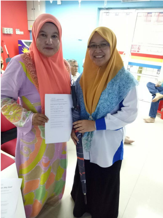
Serahan Borang PBT oleh Wakil AJK Persatuan